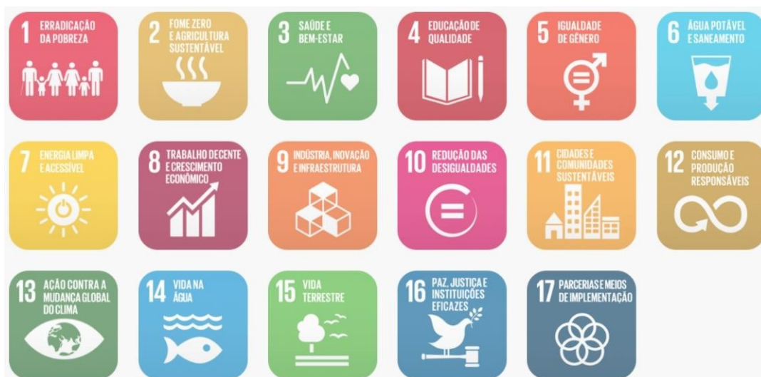
Figura 02: Objetivos de Desenvolvimento Sustentável

e o esgotamento dos recursos naturais, a produção de resíduos e o consumo de energia.